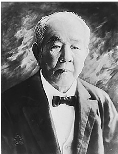
近代日本人の肖像 渋沢栄一 国立国会図書館(2013)

そして昨年9月には2021年の大河ドラマが渋沢栄一を描く「青天を衝け」に決まりました。栄一を演じるのは、若手実力派俳優の吉沢亮さんです。今注目を集めている渋沢栄一は山陽学園に来校し、講演をした記録が残っています。実業家としてだけでなく、教育や福祉にも深くかかわり、社会全体の発展に大きく貢献した人物なのです。